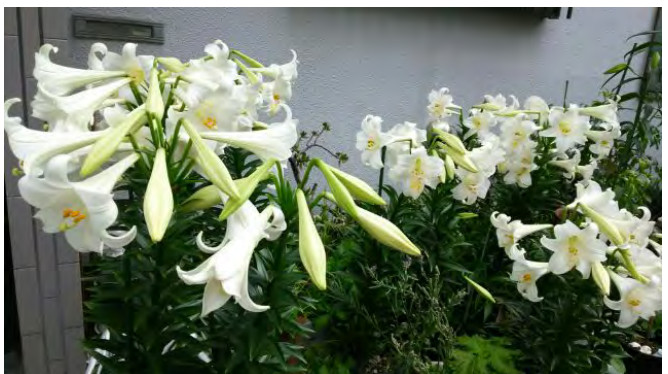
町内の百合が見事に咲いてました