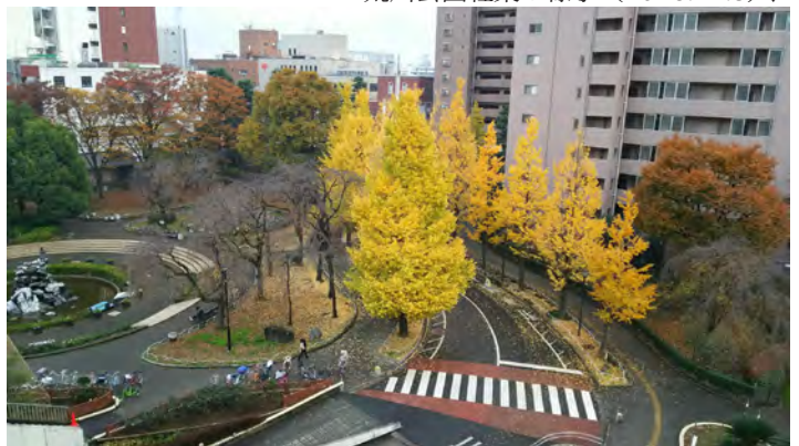
荒川公園紅葉の様子 (2015.12.3) ↓